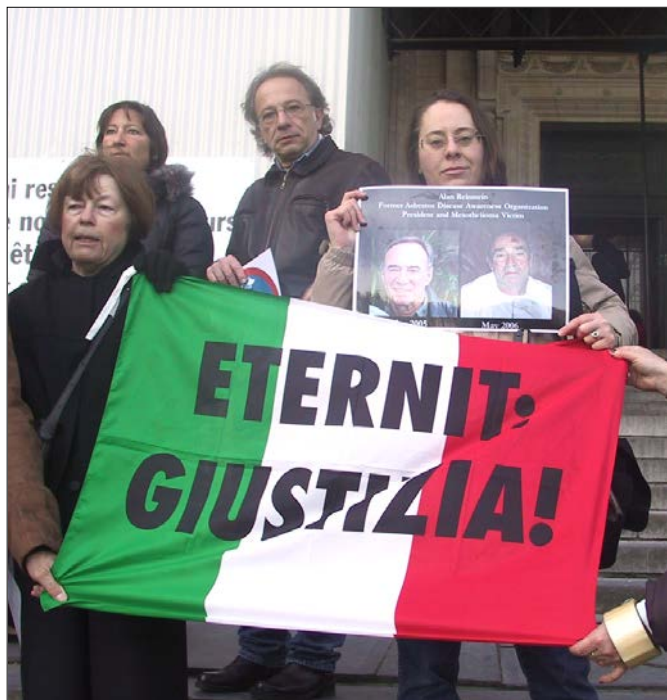
Devant le Tribunal de Turin lors du procès contre Stephan Schmidheiny responsable de la mort de milliers d'Italiens, à Casale Monferrato notamment.

* L'un des trois articles de CAOVA à paraître dans le quotidien Le Courrier début mai.