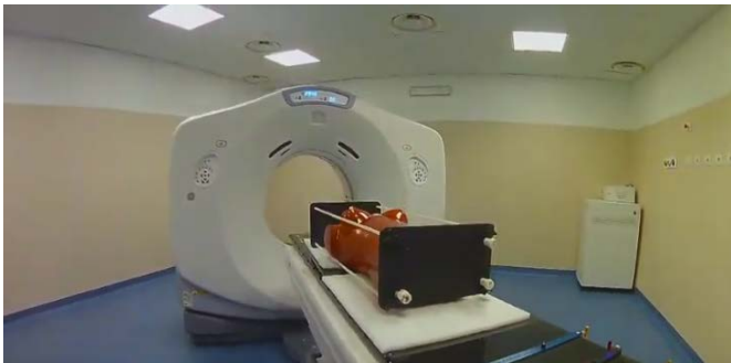
La scanner offert par le "fonds social" d'Eternit

Depuis plusieurs années, les victimes d'Eternit de Syracuse attendent toujours que justice leur soit rendue, mais faute de mieux, elles appellent Eternit au secours pour financer ses infrastructures médicales. Il s'agit notamment de l'hôpital Muscatello et de l'équipement de radiothérapie de Syracuse. Mais pour l'Observatoire national de l'amiante et la population de Syracuse (ONA), cela ne suffit pas. Il veut avant tout que justice soit faite et se demande pourquoi les responsables du massacre de travailleurs de Syracuse n'ont toujours pas été jugés.