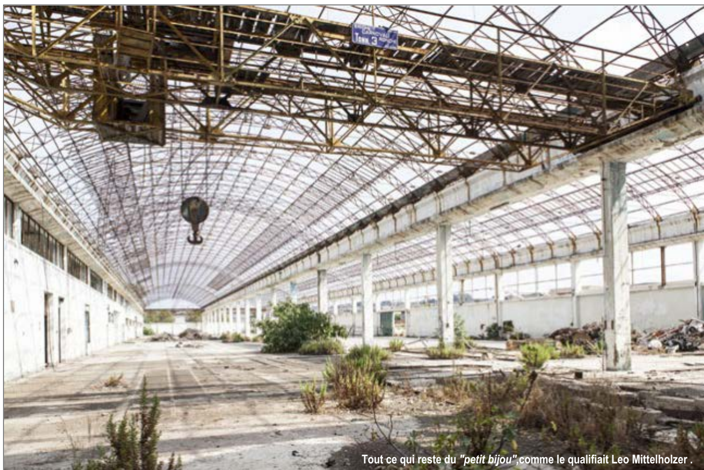
Tout ce qui reste du "petit bijou", comme le qualifiait Leo Mittelholzer .

Mais maintenant l'enquête préparatoire du procès contre son ancien actionnaire principal, Stephan Schmidheiny, PDG d'Eternit Italia SpA, de 1973 à sa faillite en 1986, devrait faire toute la lumière sur ce désastre. Le procès débutera le 12 avril 2019 à Naples.