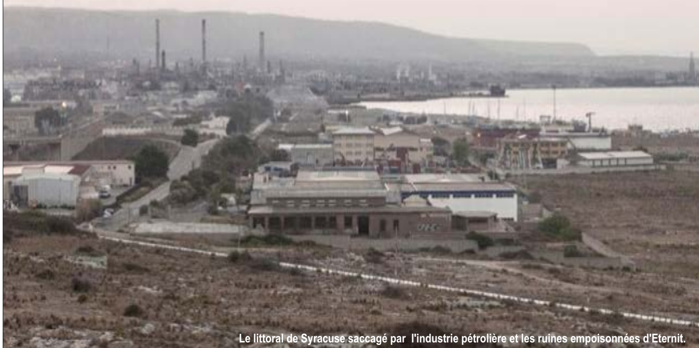
Le littoral de Syracuse saccagé par l'industrie pétrolière et les ruines empoisonnées d'Eternit.

La fabrique Eternit Siciliana SpA de Syracuse a été la seule des cinq usines Eternit d'Italie à avoir été écartée hors du procès de Turin. Pourtant, l'amiante y a tué plus d'une centaine de travailleurs et de nombreux autres luttent encore contre la mort.